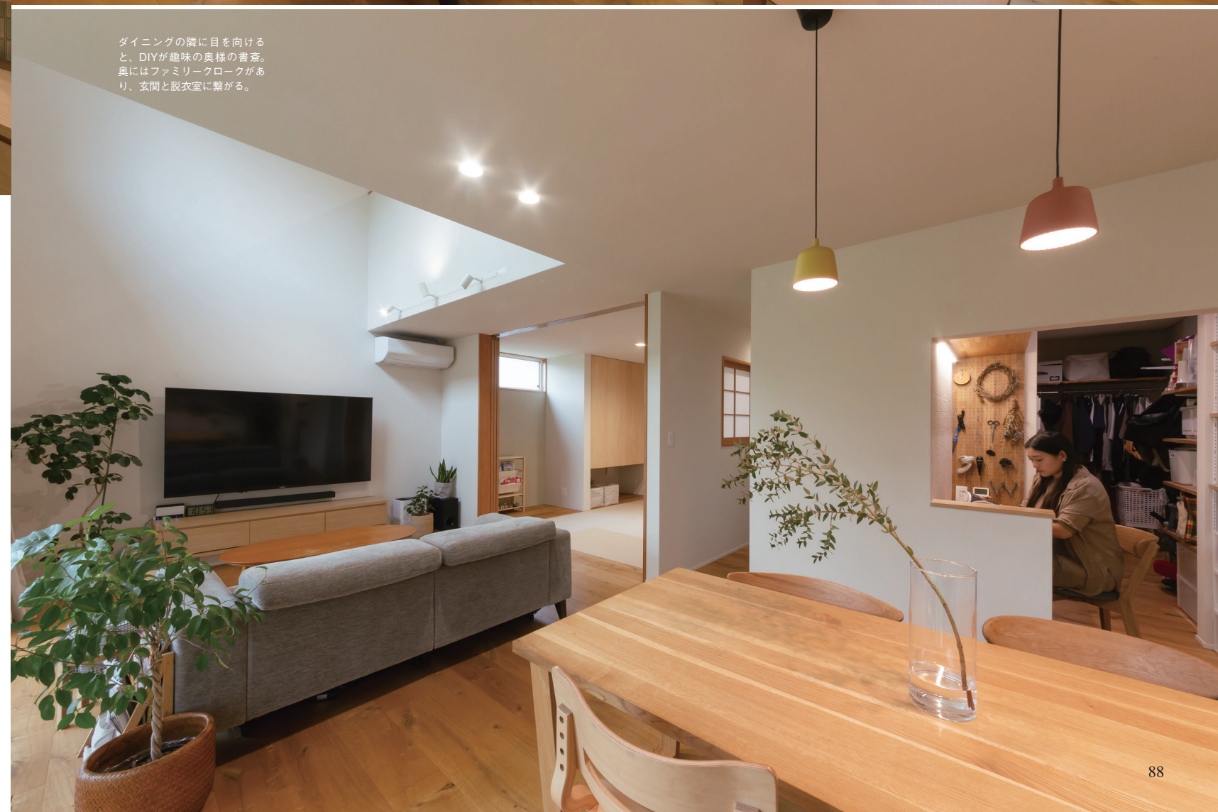
ダイニングの隣に目を向けると、DIYが趣味の奥様の書斎。奥にはファミリーロークがあり、玄関と脱衣室に繋がる。

住宅会社を選んだ決め手は？ 「デザインも性能も設備も希望を叶えてくれた、設計の自由度の高さです。」 どんな家にしたかった？ 「自然素材を使った、和モダンな家です。実際には、床にオークの挽き板を、壁と天井に珪藻土を取り入れて、優しい雰囲気仕上げてもらいました。塗り壁の一部は、私たち夫婦が手掛けた部分もあり、いい思い出になりました。将来、親と同居する可能性も想定し、障子の温かみを感じられる和室もつくりました。」 住んでみた感想は？ 「住み心地がいいです。収納スペースをたっぷり確保したので、どの部屋も片付いていいですね。また、夏も冬も快適。1階のリビングと2階フリースペースにもエアコンがあるのですが、吹き抜けと全館空調のおかげで、1台のエアコンだけで足りています。」