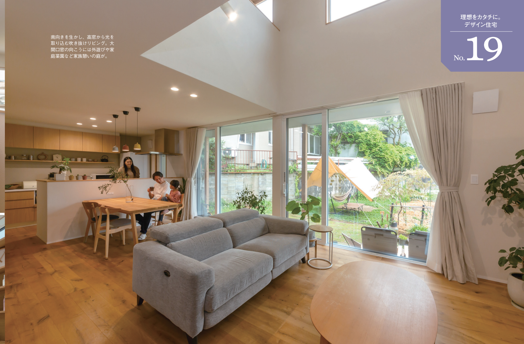
南向きを生かし、高窓から光を取り込む吹き抜けリビング。大開口窓の向こうには外遊びや家庭菜園など家族憩いの庭が。